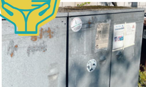
Fairteiler in der Weststadt